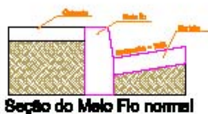
Seção do Meio Fio normal