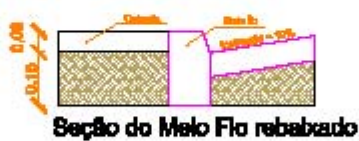
Seção do Meio Fio rebabado